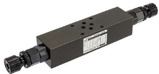
Valvola OR con controllo a pressione