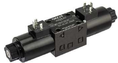
Valvola Solenoide NG6 SA