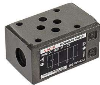
Valvola di Controllo OC