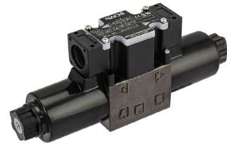
Valvola Solenoide NG6 SS con elettronica integrata